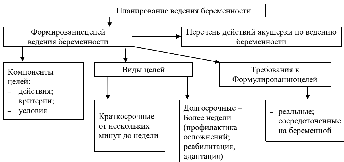
Схема 4.6 – Планирование ведения беременности.